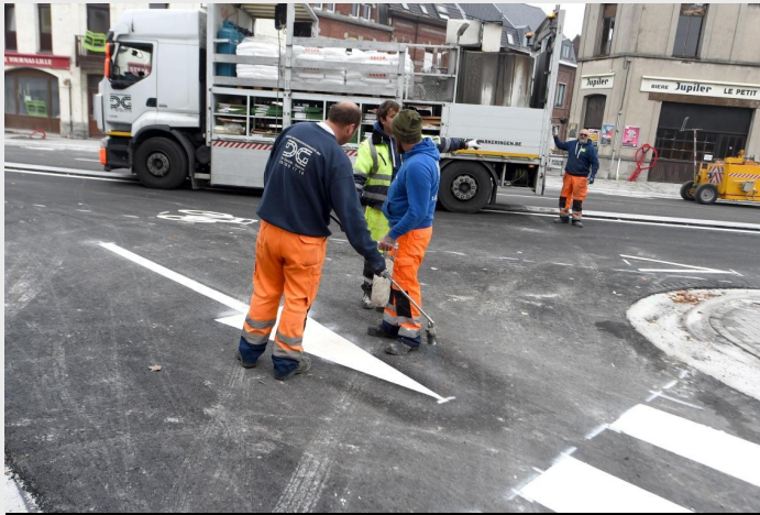
Des travaux réalisés en trois phases jusqu'au printemps 2018

sage obligé pour pas mal de planteurs qui rallient Fontenoy, et eux aussi vont devoir emprunter des itinéraires de fortune. Même si elle est temporaire, cette situation inévitable durera encore jusqu'à la fin des travaux prévus au printemps 2018. On attend avec impatience la réouverture de ce tronçon.