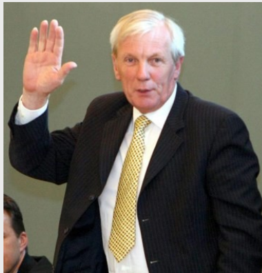
Un bourgmestre proche des mouscronnois.

Le bourgmestre de Mouscron, Alfred Gadenne a été égorgé. C'est le message qu'a reçu les services d'urgence le lundi 11 septembre vers 20 h. On voit alors des combis de police et des ambulances qui affluent au cœur de Luigne. C'est un véritable branle-bas de combats d'ambulanciers appuyés par le Samu. La police est déployée tout autour du lieu de recueillement dressant un périmètre de sécurité. En allant fermer les grilles du cimetière, comme il le faisait au quotidien depuis des années, Alfred Gadenne s'est fait agressé par un in-