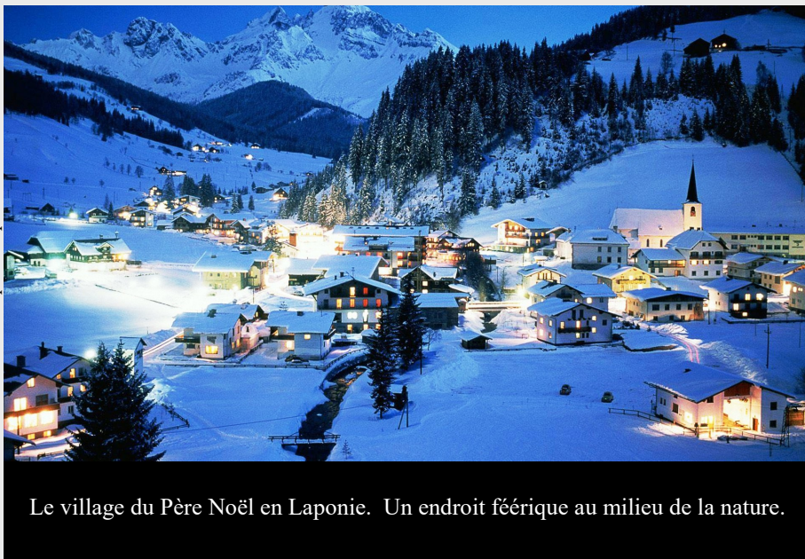
Le village du Père Noël en Laponie. Un endroit féérique au milieu de la nature.

finlandaise. L'emplacement exact étant un secret connu seulement de quelques privilégiés, il a décidé d'établir un bureau à Rovaniemi, la capitale de la Laponie, en 1985. Rovaniemi a reçu le statut de ville officielle du Père Noël en 2010. A priori, on pourrait se dire que le mont Korvatunturi, avec sa situation loin de tout en pleine nature sauvage, n'est pas vraiment l'endroit idéal pour gérer un ser-