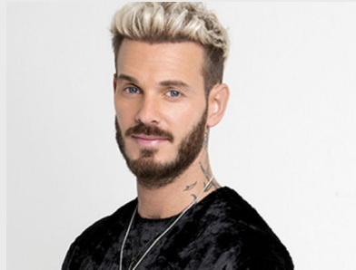
M. Pokora, un chanteur au top des classements