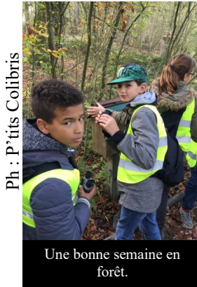
Une bonne semaine en forêt.