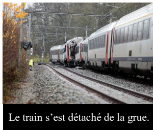
Le train s'est détaché de la grue.

Un train accidenté a percuté un train de voyageurs, après s'être détaché du train-grue lors de l'opération de levage. Le train accidenté a alors dévalé plusieurs kilomètres.