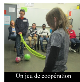
Un jeu de coopération

le chemin parcouru depuis et découvrir d'autres chouettes activités.