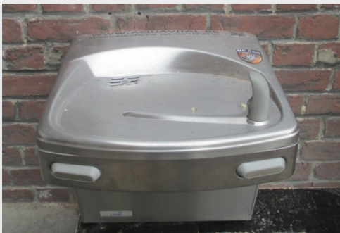
Les élèves peuvent s'abreuver durant les récréation et après les cours de gymnastique grâce au Rotary