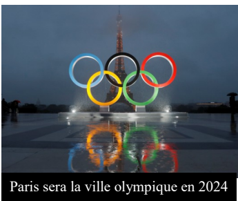
Paris sera la ville olympique en 2024

Paris accueillera les jeux olympiques et paralympiques pour la première fois depuis un siècle. La capitale avait en effet déjà accueilli les J.O. ... en 1924. Une précédente édition avait déjà eu lieu en 1900 mais, noyé dans la concurrence de l'Exposition universelle, l'événement n'avait pas