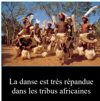
La danse est très répandue dans les tribus africaines

La danse africaine est une danse typique de la culture africaine. Plusieurs sortes de danses africaines sont énumérées dans une liste de danses. Ces danses ont toutes un contexte géographique, historique et social différents. Elles servent à exprimer chaque étape dans la vie d'un homme africain. Elles sont pratiquées par des hommes, ces danses sont effectuées lors des mariages, des fêtes, etc. Elles sont un moyen d'expression, c'est-à-dire qu'elles