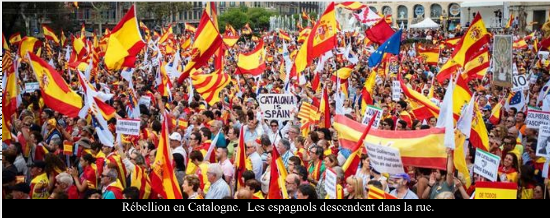
Rébellion en Catalogne. Les espagnols descendent dans la rue.

C'est la guerre depuis le 1 er octobre entre le gouvernement espagnol et les catalans. En effet, ceux-ci désirent l'indépendance de la Catalogne !