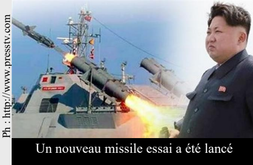
Un nouveau missile essai a été lancé