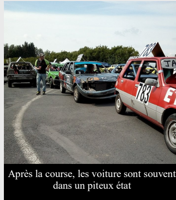
Après la course, les voitures sont souvent dans un piteux état

Traditionnellement les courses se pratiquent sur des circuits en forme d'ovale. Les meilleures courses se jouent sur des distances allant de 322 à 966 Kilomètres. Les voitures développent des puissances de 860 à 900 chevaux grâce à leur moteur V9. Les origines des courses de stock-car sont liées à la contrebande d'alcool aux Etats-Unis du temps de la prohibition, dans les années 1930, afin d'échapper plus facilement aux forces de police. Les trafiquants modifient leurs automobiles pour les rendre plus performantes. Rapidement, des courses sauvages entre contrebandiers se propagent. Les courses de stock-car