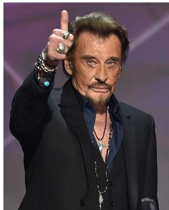
Johnny Hallyday n'est plus !

Johnny Hallyday est mort dans la nuit du 5 au 6 décembre dans sa maison près de Paris. Il luttait depuis un an contre un cancer, qui a fini par l'emporter. A l'annonce de son décès, les hommages ont afflué en masse du monde entier. Johnny était une véritable star. Il avait vendu plus de 100 million de disques et rempli d'innombrables fois les grandes salles et stades de France, de Belgique et d'ailleurs. Johnny s'appelait en fait Jean-Philippe Smet. Il était né pendant la seconde guerre mondiale en 1943, à Paris. Son père, un artiste de cabaret belge abandonne sa fa-