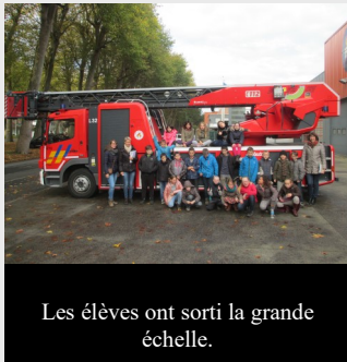
Les élèves ont sorti la grande échelle.

Une visite chez les pompiers afin de mieux découvrir ce courageux métier.