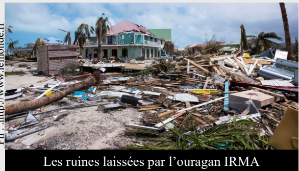
Les ruines laissées par l'ouragan IRMA

indiqué Didier Reynders. Pour les belges qui étaient en voyage sur place, les tours opérateurs avaient pris des initiatives de les déplacer vers d'autres hôtels. L'ouragan Irma, c'est : 360 km/h (la vitesse des vents au sein de l'ouragan) ; 644 km (la largeur maximale de celui-ci) ; 100 milliards de dollars (c'est le coût estimé des dégâts) ; 6,4