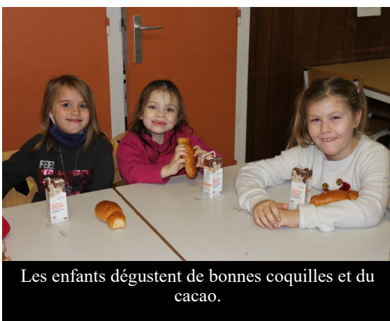
Les enfants dégustent de bonnes coquilles et du cacao.

Coquilles et cacao au programme d'un déjeuner convivial pour Noël.