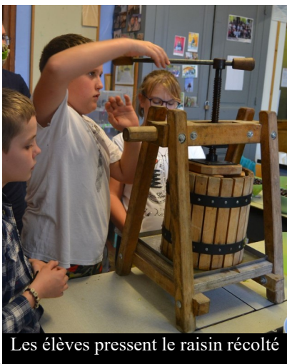
Les élèves pressent le raisin récolté

Grâce à l'action « Arbrenkit » (voir article page 6), les élèves ont produit du bon jus de raisin.