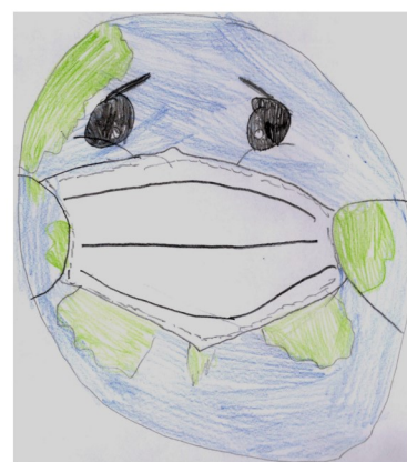
Illustrations de Romain C.

Les masques sont devenus obligatoires pour les adultes ainsi que pour les enfants de plus de 12 ans. Sans compter que plusieurs fois par jour, nous devons nous laver ou désinfecter les mains. Ce respect des règles et des gestes barrières est très important afin de nous préserver de ce virus. Si certains sont atteints de symptômes spécifiques, ils doivent se faire tester (c'est-à-dire que l'on enfonce une tige dans le nez pour faire un petit prélèvement). Si le test est négatif, ils peuvent revenir à l'école tandis que si c'est positif, d'autres mesures doivent être mises en place.