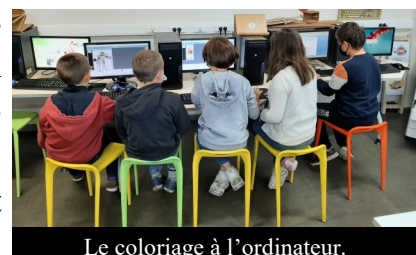
Le coloriage à l'ordinateur.

Wallonie Bruxelles, qui a offert, cette année, une cinquantaine de livres à notre école. Un beau projet d'une année qui a captivé les élèves.