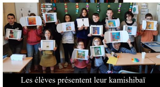
Les élèves présentent leur kamishibaï