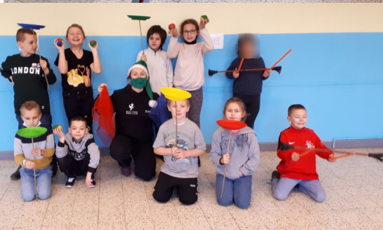
Les élèves s'essaient aux arts du cirque

appris à jongler avec des foulards, des balles, des bâtons,... Ils ont aussi essayé les assiettes chinoises et le diabolo ! Les enfants se sont bien amusés, tous avaient le sourire !