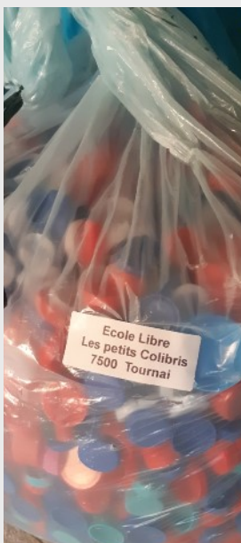
Des bouchons pour les aveugles

aveugles à éduquer des chiens pour ces derniers.