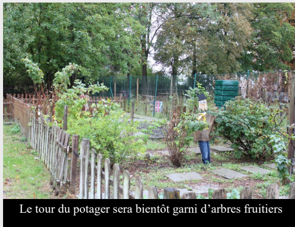
Le tour du potager sera bientôt garni d'arbres fruitiers