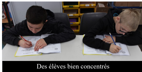
Des élèves bien concentrés