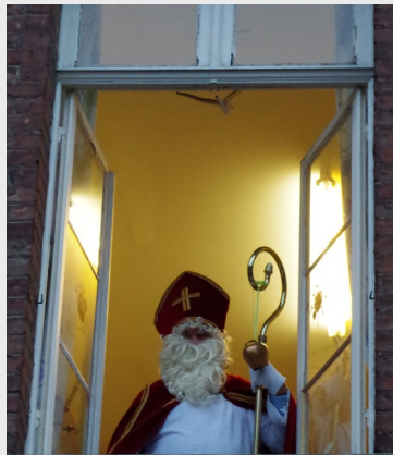
Saint-Nicolas est apparu à la fenêtre pour saluer les enfants de l'école.

s'excuser de ne pouvoir les approcher comme les autres années et leur remettre leur cadeau. Mais les mesures liées au coronavirus ne le permettaient pas. Après cette brève discussion, les élèves ont entonné le chant « Ô grand Saint-Nicolas » puis sont rentrés dans leur classe où ils ont découvert les friandises apportées par le grand Saint. Les élèves, suite à leur bonne action de la veille avaient reçu le droit d'aller voir un film avec pop corn et boissons offerts par un de nos sponsors (Ets Devanne Plafonnage) que nous remercions. Une bonne journée de détente.