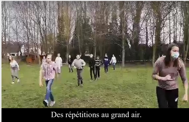
Des répétitions au grand air.

Dans le cadre du cours de gymnastique et en collaboration avec madame Fabienne, nous avons comme projet de réaliser un « flashmob ». Les classes des plus jeunes réalise-