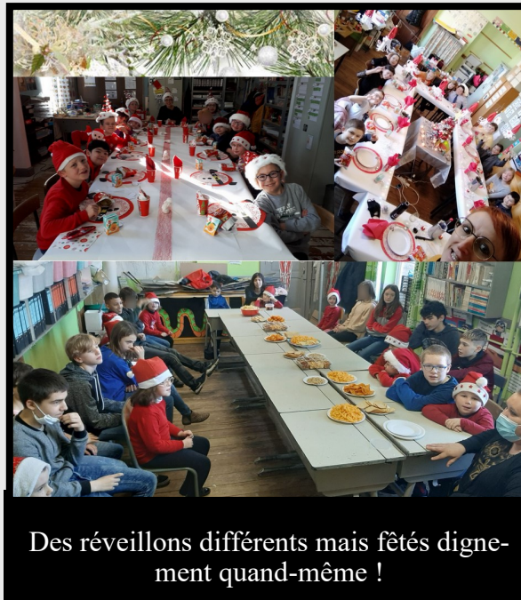
Des réveillons différents mais fêtés dignement quand-même !

Dans l'après-midi, les deux classes ont regardé un film : « Le Dr Dolittle ». Ce film a beaucoup plu aux grands comme aux petits. Ce parrainage apporte énormément de bonheur à tous.