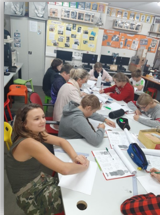
Les élèves s'appliquent à dessiner le personnage de Tintin.

rentes versions de la BD (anglais, chinois, africains,...)