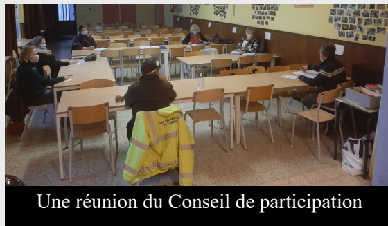
Une réunion du Conseil de participation

tionnés par la Communauté française. Le conseil de participation réunit 4 fois par an des représentants de l'école :