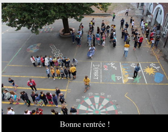
Bonne rentrée !